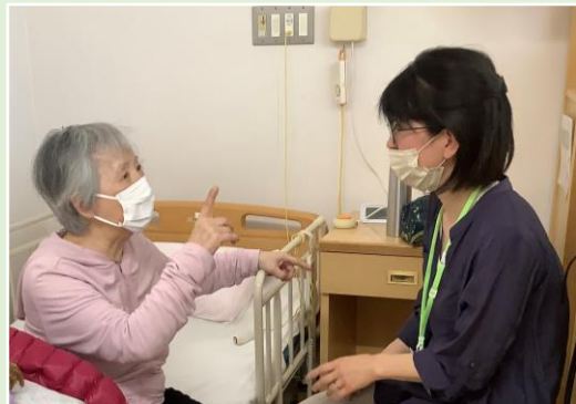
「久しぶり！元気？」やっと直接お会いいただけるようになりました

制限時にご利用を開始された方のご家族の中には、まだフロアやお部屋の様子をご存じない方もおられるかと思えます。皆様のお越しをお待ちしています。(3階フロア責任者 古川哲也)