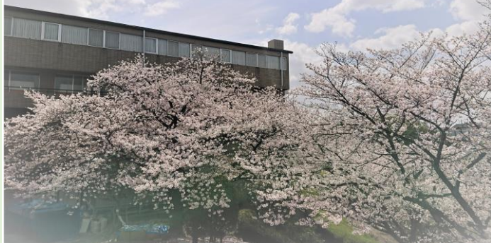
今年も桜 (染井吉野) がベテルの春を可憐に彩りました

施設理念：私たちは、お一人おひとりを尊重し 「健康」「生きがい」「安心」を支援し続けます